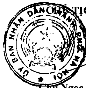
Chu Ngọc Anh